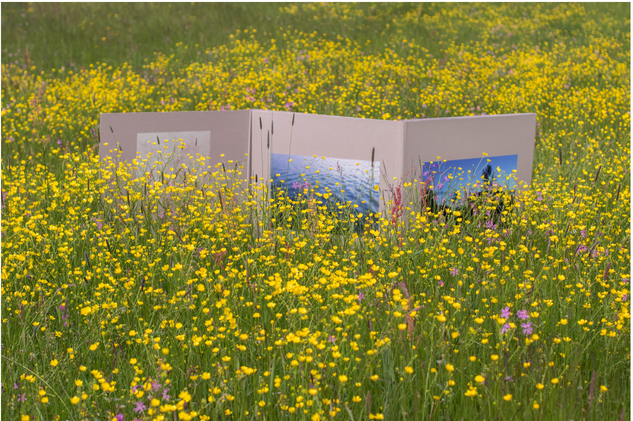
Obr. 2: Náhl'ad čiastočne rozpestretého leporela z bakalárskej práce v priestore lúky

podmienky pre dosiahnutie žiadanej atmosféry. Pracujem so základnými elementmi a bežnými materiálmi ako je papier, textil, drevo, plast alebo sklo a využívam ich vlastnosti pri vytváraní videného aj kontextuálneho obrazu fotografie.